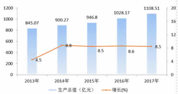
图1 2013年-2017年地区生产总值及其增速

全年一般公共预算收入 144.18 亿元,比上年增长 5.1%。其中,一般公共预算收入 92.6 亿元,下降 3.3%。财政收入占地区生产总值的比重为 13.0%,下降 0.3 个百分点;税收总收入 108.05 亿元,增长 7.7%,占财政总收入的比重 74.9%,比上年提高 1.7 个百分点。分县、渝水区财政总收入超过 30 亿元,高新区、仙女湖区超过 20 亿元。