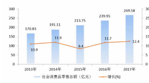
图4 2013年-2017年社会消费品零售总额及其增速

全年限额以上批零住餐企业实现零售额 100.19 亿元,比上年增长 16.4%;其中批发零售企业零售额 88.4 亿元,增长 16.8%;住宿餐饮业零售额 11.79 亿元,增长 13.3%。分商品看,粮油、食品类增长 27.4%,服装、鞋帽、针纺织品类增长 16.7%,日用品类增长 7.3%。与消费升级相关商品保持快速增长,娱乐用品类实现零售额增长 39.2%,建筑及装潢材料类增长 35.4%,通讯器材类增长 30.5%,中西药品类增长 28.2%,家具类增长 20.5%,金银珠宝类增长 17.7%。“互联网+”消费业态势头向好。全市限额以上批发零售业通过公共网络实现零售额增长 41.8%。