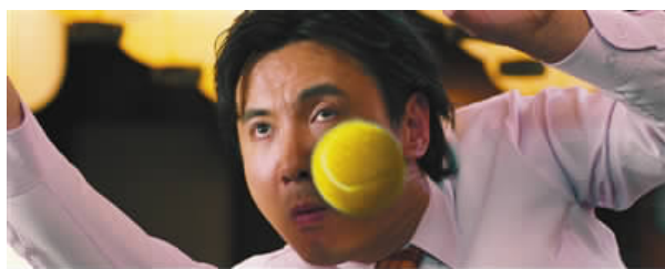
沈腾 饰 王多鱼